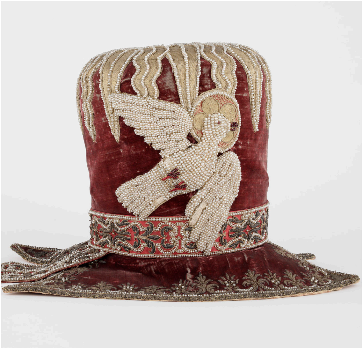
Miecz poświęcany z pochwą i pasem oraz kapelusz poświęcany