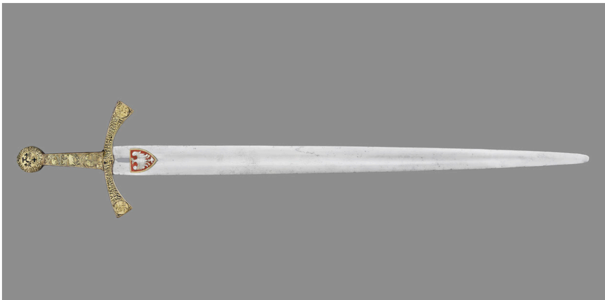
Szczerbiec, fot. Dariusz Błażewski

rycznej. Można powiedzieć, że dla Szczerbca stworzono swego rodzaju sanktuarium – mówi prof. Andrzej Betlej.