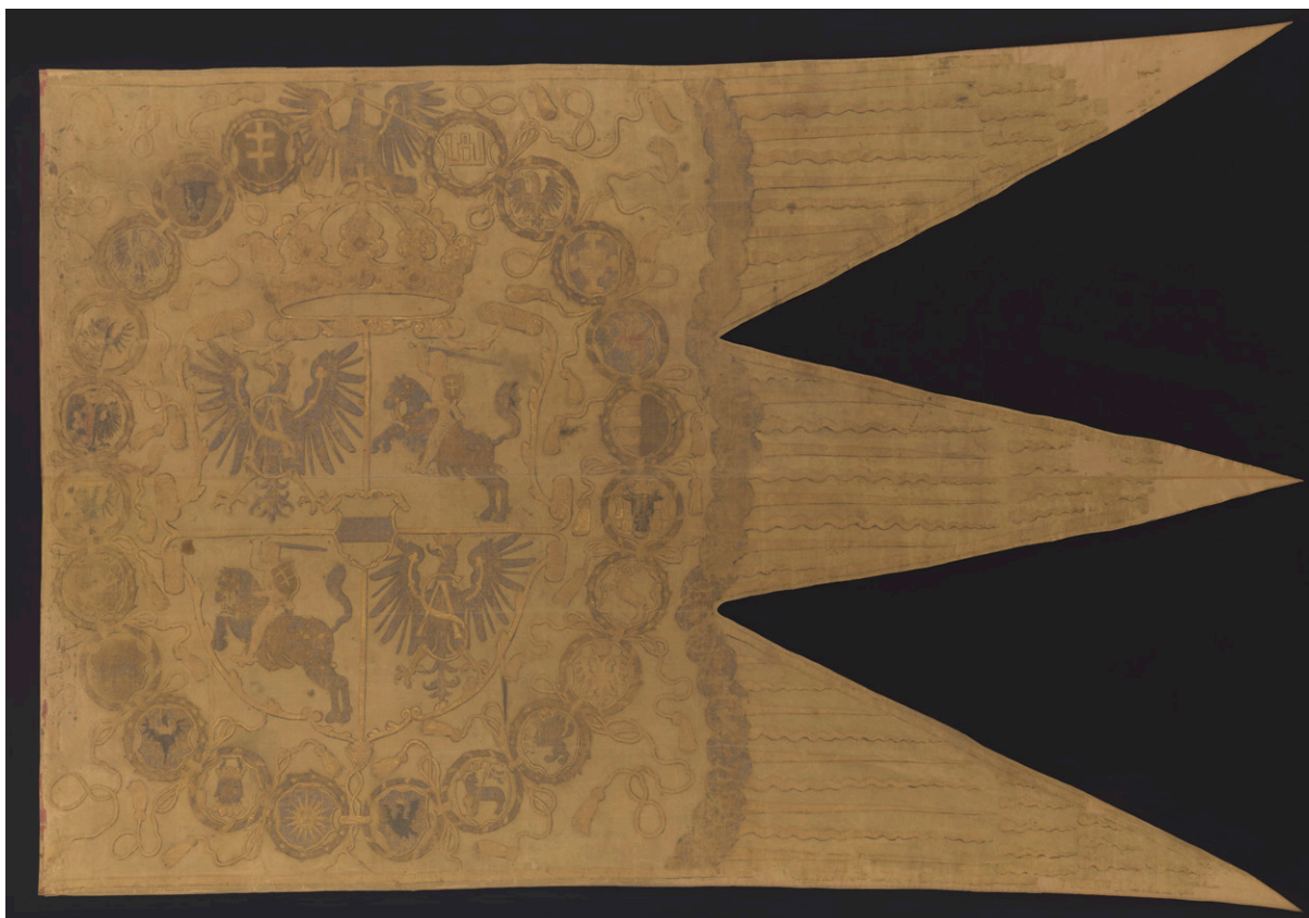
Chorągiew nadworna z czasów Zygmunta Augusta

To arcydzieło europejskiego jubilerstwa zakupiono do zbiorów Zamku Królewskiego na Wawelu od Lubomirskich w 1936 roku.